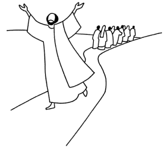
JF Kieffer - Le lépreux guéri.

Jésus lui dit : « Relève-toi et va : ta foi t'a sauvé. »